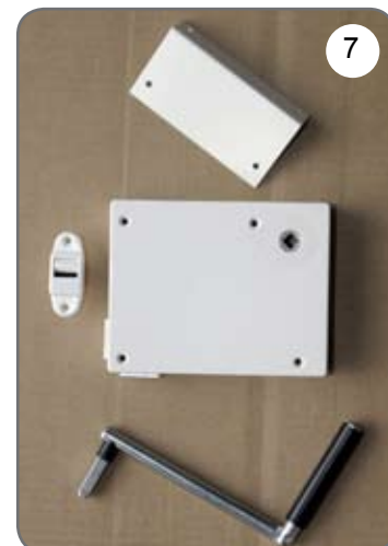
Kaseta z przekładnią na taśmę (pasek), płytka do mocowania kasety, prowadnica taśmy (paska), korba [7].