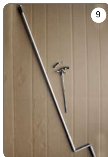
Korba, przegub Cardana 45° lub 90° z zaczepem dzwinkowym [9].