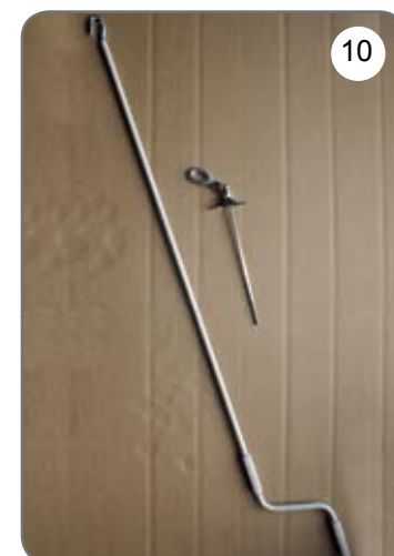
Korba, przegub Cardana 45° lub 90° z uchem [10].