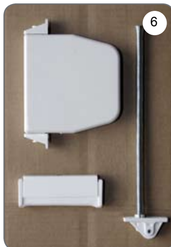
Zwijacz na linę, prowadnica linki, uchwyt linki [6].