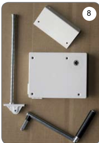
Kaseta z przekładnią na linę, płytka do mocowania kasety, prowadnica linki, korba [8].