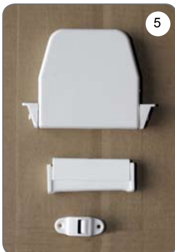
Zwijacz na taśmę (pasek), prowadnica taśmy (paska), uchwyt taśmy (paska) [5].

b) Rodzaje stosowanych napędów ręcznych (opcje):