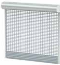
BKR / SKO-P