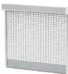
BKR / SK