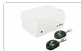
Centralki z pilotami