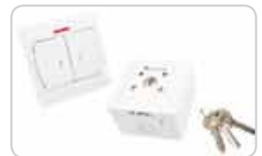
Przełączniki klawiszowe i kluczykowe