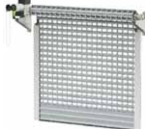
BKR / KNS