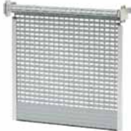
BKR / KNB